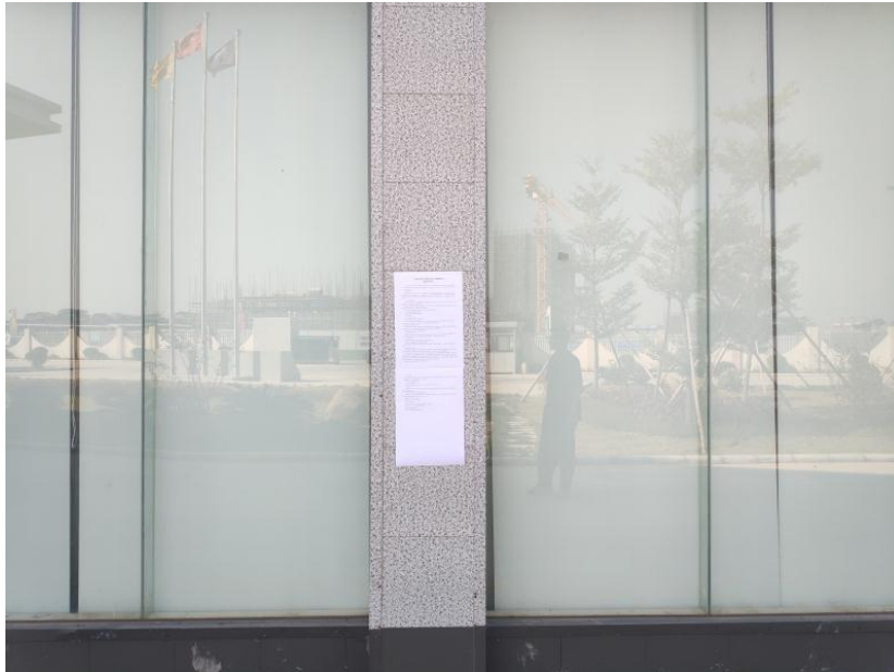
图 3.2-4 现场公示情况